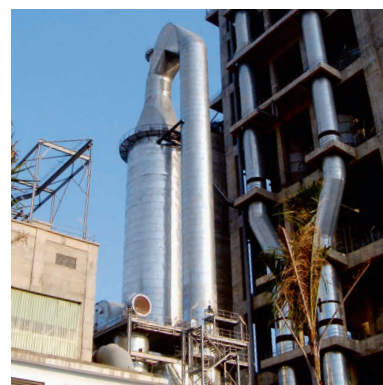
ЦЕМЕНТНЫЙ ЗАВОД, ВЬЕТНАМ ПЕЧЬ С ТЕПЛОБМЕННИКОМ