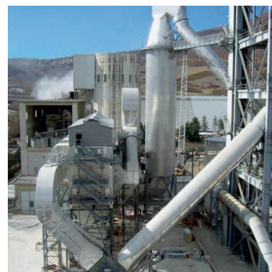
ЦЕМЕНТНЫЙ ЗАВОД, ИТАЛИЯ ПЕЧЬ С ТЕПЛОБМЕННИКОМ

Идеальная конструкция башни-кондиционера и его адаптация к целевым спецификациям установки являются решающими элементами в достижении максимальной степени эффективности и долгого срока службы всей установки. Опыт наших инженеров гарантирует правильное технологическое решение для создания правильных физических условий.