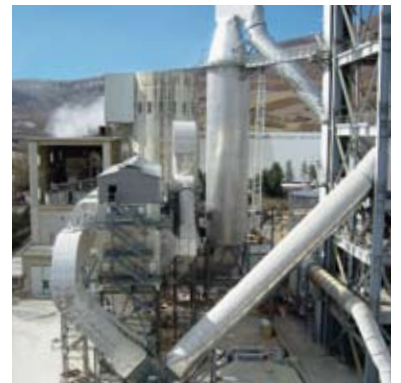
ZEMENTWERK, Italien WÄRMETAUSCHEROFEN

Die perfekte Konzipierung des Verdampfungskühlers sowie seine exakte Anpassung an die übrigen Aggregate und an die Zielerfordernisse der Gesamtanlage sind entscheidend für den maximalen Wirkungsgrad und eine lange, pannenfreie Lebensdauer der gesamten Anlage. Die Erfahrung und die Gewissenhaftigkeit unserer Ingenieure gewährleisten Ihnen die genau richtigen technologischen Rezepte für die Schaffung der genau richtigen physikalischen Bedingungen.