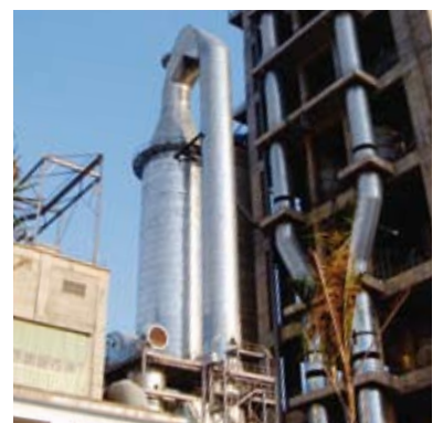
ZEMENTWERK, Vietnam WÄRMETAUSCHEROFEN